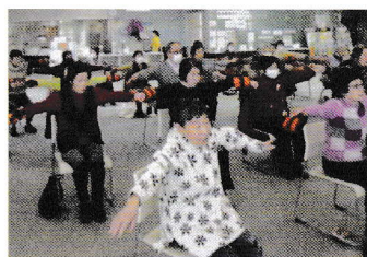
くしぞ〜かでん伝体操>