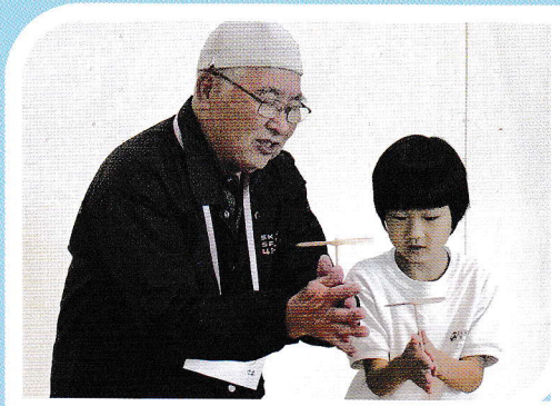
「生活科／昔の遊びを楽しもう」 地域の老人クラブの方と