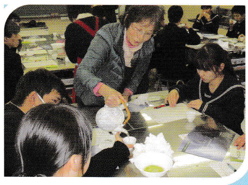
「総合的な学習／闘茶会」 地域のインストラクターさんと