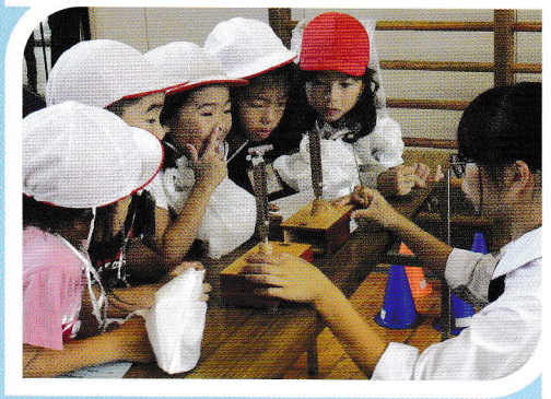
「放課後子ども教室／科学実験」 静岡市立高校の生徒さんと